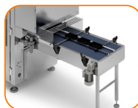
Transportador de Saída Motorizado