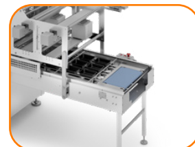
Sistema Automático de Entrada de Bandejas