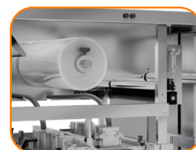
Rebobinador Automático de Filme