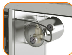
Tanque de Gás em Aço Inoxidável