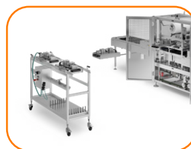
Carrinho em Aço Inoxidável